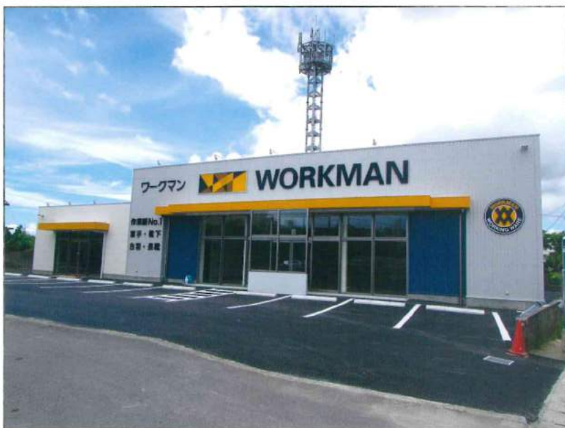
ワークマン うるま石川店

平成29年7月20日、沖縄県うるま市石川242-1-3に「ワークマンうるま石川店」がオープン致しました。個人向けのワーキングウェア（作業服）、つなぎ、着服、防寒着、安全靴、長靴、レインスーツ（合羽）と作業関連用品の小売りでは、圧倒的No.1のシェアを誇るワークマンが「働く人に、便利さ」をお届けします。