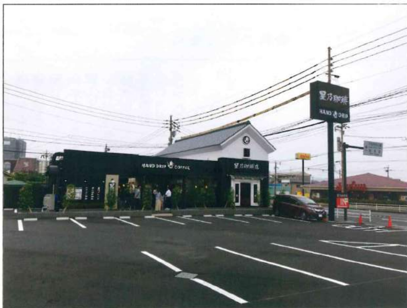
星乃珈琲店 大分店

平成29年5月31日、大分県大分市津留1932-1に「星乃珈琲店大分店」がオープン致しました。大分県での出店は初となり、九州未出店エリアは残り宮崎県のみとなりました。オープン当日は開店1時間前からお客様が並び始め、早朝にも関わらずオープン時間には30人以上が並ぶ大盛況となりました。お近くにお越しの際は、是非お立ち寄りくださいませ。