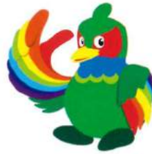
H・Cイメージキャラクター「キジー」

今回、皆様にはお詫び申し上げなければなりません。弊社H・Cは、まだまだ皆様方に自社のことをしっかりとお伝え出来ていなかったと反省いたしました。誠に申し訳御座いませんでした。そこで、改めて弊社の事を知って頂くための第一歩として、弊社のイメージキャラクターとホームページをリニューアル致しましたのでご紹介させていただきます。