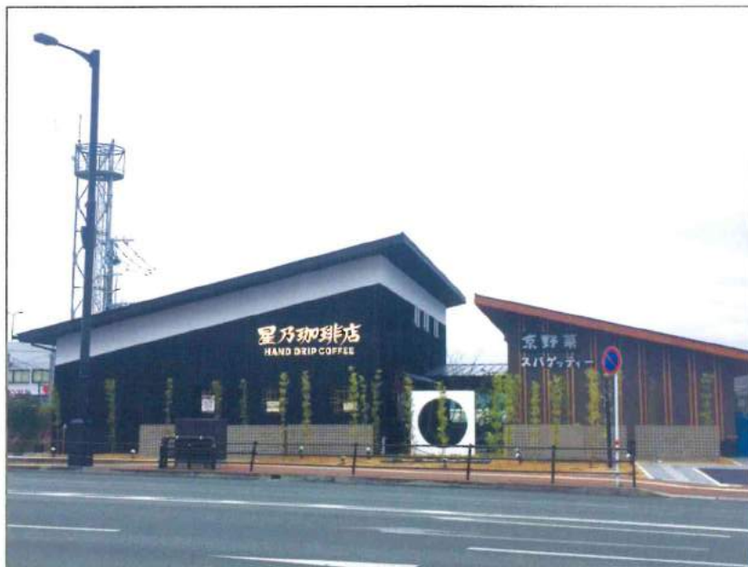
星乃珈琲店・先斗入ル 熊本近見店

平成29年2月28日、熊本県熊本市南区近見7-1-33に「星乃珈琲店熊本近見店」と「京風スパゲッティ先斗入ル熊本近見店」がオープン致しました。おいしいコーヒーとゆったりとした時間を楽しみたい方は星乃珈琲店へ。また、京野菜を中心とした京風創作パスタに舌鼓を打ちたい方は先斗入ルへ是非お越しくださいませ。